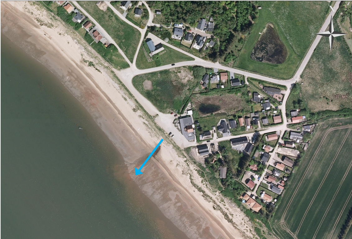
Overblik over nærmeste mulige kilder til fækal forurening af badevandet ved Sjelborg Strand

Esbjerg Kommune opfordrer til, at strandens gæster bader indenfor den definerede afgrænsning af stranden, hvor kommunen rutinemæssigt kontrollerer badevandskvaliteten i badevandssæsonen (1. juni – 1. september).